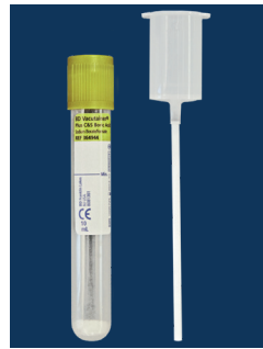
UCK-Röhrchen und Urintransfereinheit